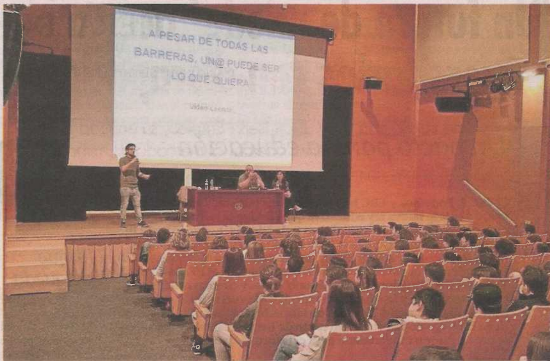
Charla impartida a alumnos del CEIP Tenerías, referentes positivos en el ámbito educativo. FUND. CAI