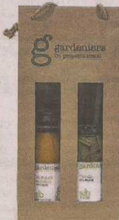
Uno de los lotes de Gardeniers.

El Centro Especial de Empleo Gardeniers, de Atades-Asociación Tutelar Aragonesa de Discapacidad Intelectual, ofrece cestas de productos ecológicos, elaborados y producidos por personas con discapacidad intelectual y diversidad funcional. El lanzamiento de los lotes coincide con la proximidad de las Navidades y demanda de productos solidarios, y se ofrecen a empresas y particulares. Todos los productos que incluyen son certificados y proceden de los cultivos ecológicos de Gardeniers en Sonsoles (Alagón), además de miel ecológica de trashumancia