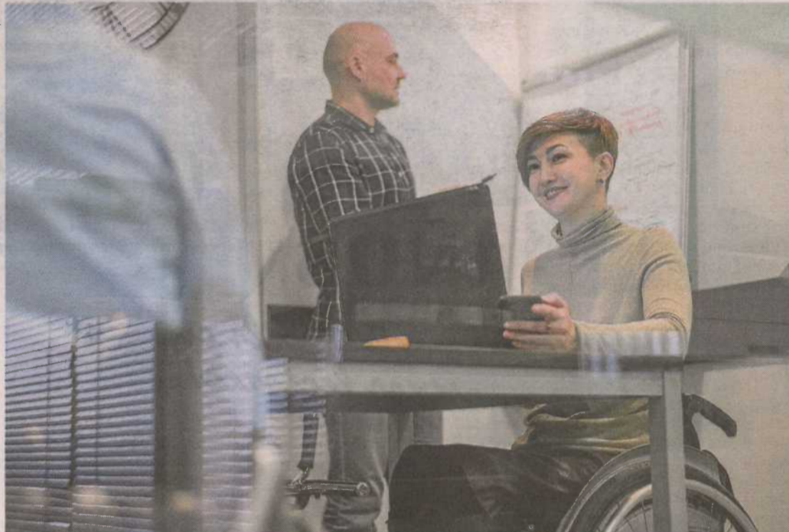
Los universitarios con discapacidad tienen a su disposición ofertas de empleo y una bolsa de trabajo.

Los universitarios con discapacidad tienen a su disposición la web del proyecto, en la que, además de acceder directamente a diversas ofertas de empleo, pueden dejar sus datos para inscribirse en la bolsa de trabajo de Inserta Empleo. Esta iniciativa se enmarca en los programas operativos de Inclusión Social y de la Economía So-